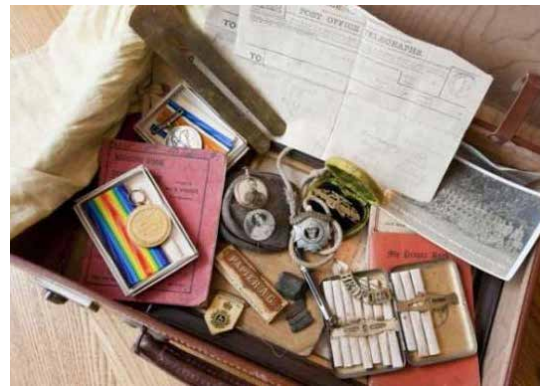
Ejemplo de cápsula del tiempo de la primera guerra mundial.

Una cápsula del tiempo es un recipiente que, generalmente, se realiza de un material sólido. Su objetivo es guardar objetos por un largo tiempo, de manera que en un futuro otras generaciones puedan abrirla y conocer aspectos de épocas anteriores a través de lo depositado en su interior. La llamada “Cripta de la civilización”, realizada en 1936, es reconocida como el primer intento de la sociedad moderna por realizar una cápsula del tiempo. Su apertura se programó para el año 8113.